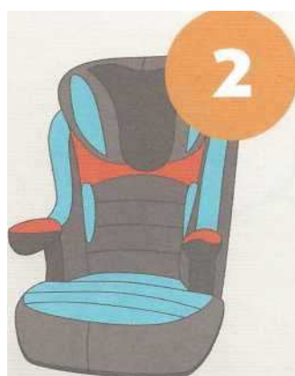
15-25 кг от 3 до 7 лет