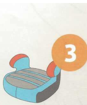
22-36 кг от 6 до 12 лет