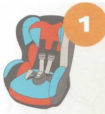
9-18 кг от 9 месяцев до 4 лет